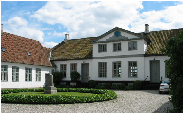
Farumgård er i privat eje. Der er offentlig adgang gennem gården, men kun til fods. Cyklister må følge den afmærkede rute op gennem byen.

En ås ved Gretesholm har dannet et næs ud i Farum Sø. Her ligger jættestuen på Gretesholm ved et af oldtidens vigtige overgangssteder. På bakken overfor jættestuen er der gjort fund af flinteaffald, skræbere, flækker og slæbne tyknakkede økser.