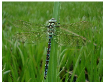
< Grøn mosaikguldmed