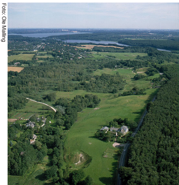
Mølleådalen med Kalkgården nederst til højre og Farum Sø og Furesø i baggrunden.

Mølleådalen er en del af et stort, forgrenet dalsystem mellem Roskilde Fjord og Øresund. Der er forskellige bud på, hvordan dalene kan være dannet. Den ene går på, at det er smeltevandsfloder under istidens gletsjere, som har skåret tunneldale ned i undergrunden. En anden teori går på, at der inden istiden er sket forskydninger i de kalklag, der ligger under jordlagene. Disse forskydninger har så dannet et system af dale, som senere er blevet gennemstrømmet af istidens smeltevand.