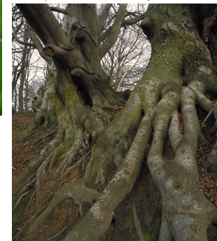
v Overjordisk rodnet fra bøg i Farum Skov

Mange af skovene i området er gamle græsningsskove. Det ses af stednavnene Farum Lillevang, Nyvang og Ganløse Ore. "Vange" var indhegninger til græsning og "øre" er et gammelt ord for græsningsoverdrev. Mange steder kan man se de gamle flerstammede bøge, som har fået deres skæve former af husdyrenes gnav og slid. Flere af skovene er i dag udpeget til naturskov, hvor væltede træer får lov til at ligge til glæde for svampe og insekter.