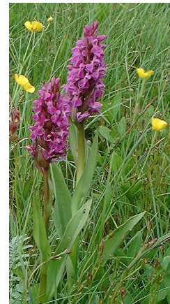
Orkidéen, Maj-Gøgeurt kan opleves i Krogenlund Mose

Mølleådalen fra Buresø til Furesø rummer mange unikke og værdifulde naturtyper, som er gået kraftigt tilbage både i Danmark og i hele Europa. Hele strækningen er derfor udpeget NATURA 2000 område, et værdifuldt naturområde af international betydning. Krogenlund Mose, Klevads Mose og Farum Sortemose, er vigtige levesteder for insekter og fugle og her findes et stort antal sjældne planter, som netop er afhængige af næringsfattig, fugtig og lysåben natur. For at hindre områderne i at gro til i skov medvirker Frederiksborg Amt til opsætning af hegn for græssende kreaturer eller udfører egentlig naturpleje.