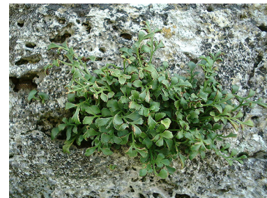
Den meget sjældne plante Murrude kan ses på de lodrette flader af Bastrup Tårn

Mange af skovene i området er gamle græsningsskove. Det ses af stednavnene Farum Lillevang, Nyvang og Ganløse Ore. "Vange" var indhegninger til græsning og "øre" er et gammelt ord for græsningsoverdrev. Mange steder kan man se de gamle flerstammede bøge, som har fået deres skæve former af husdyrenes gnav og slid. Flere af skovene er i dag udpeget til naturskov, hvor væltede træer får lov til at ligge til glæde for svampe og insekter.